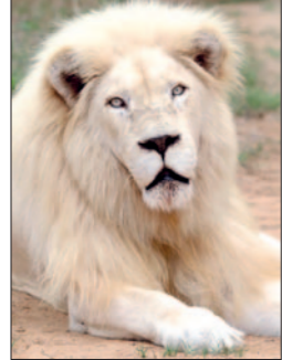
Mehr als nur eine Laune der Natur: Weiße Löwen